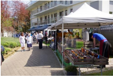
2 de editie van de lentemarkt op zondag 28 april 2019

Op zondag 28 april organiseren we een 2 de editie van de lentemarkt. Dit jaar volledig in het teken “mobiel met de Riksja”, maar er is meer. Het optreden van Next Level Kids, de demoteam’s Adults, Junioren en Unstepable en de workshop Zumba voor jong en oud, georganiseerd door Step By Step, mag je zeker niet missen.